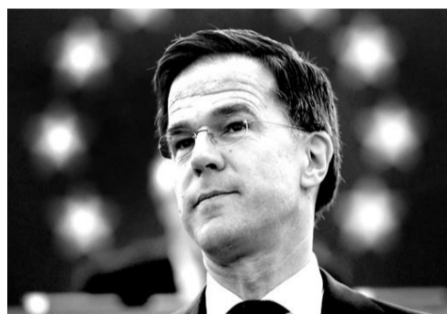
NATO-nun Baş katibi Mark Rutte Avropa ölkələrini müdafiə xərclərini artırmağa və müharibəyə hazırlaşmağa çağırır.

O, bu barədə "Bild" qəzetinə müsahibəsində deyib.