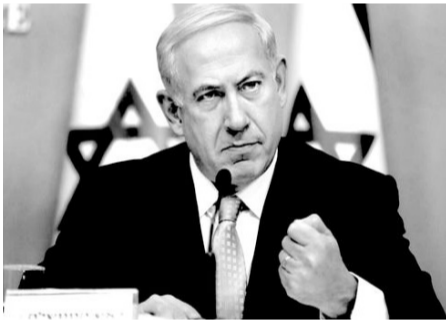
İsrailin Baş naziri Benjamin Netanyahu Fələstinin HƏMAS hərəkətinin liderləri sürgünə göndərildiyi

təqdirdə, Qəzza zolağında müharibəni dayandırmağa hazır olduğunu açıqlayıb.