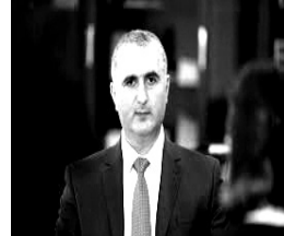
Laşa Xutsişvili Gürcüstanın maliyyə naziri