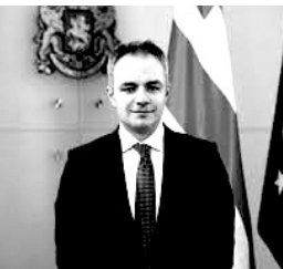
Aleksandre Tsuladze Gürcüstanın təhsil, elm və gənclər naziri