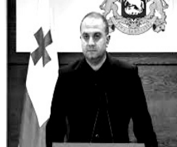
İrakli Çikovani Gürcüstanın müdafiə naziri