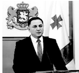
Vaxtanq Qomelauri Gürcüstanın daxili işlər naziri