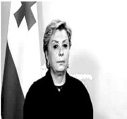
Tinatin Ruxadze Gürcüstanın mədəniyyət və idman naziri