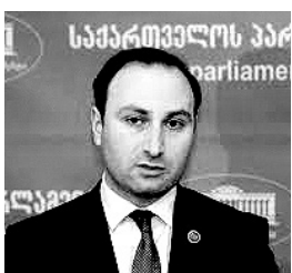
Anri Oxanaşvili Gürcüstanın ədliyyə naziri