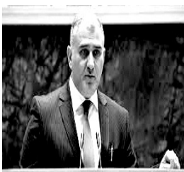
Mixeil Sarcveladze Gürcüstanın işğal olunmuş ərazilərindən olan məcburi köçkünlərin əmək, səhiyyə və sosial müdafiəsi naziri