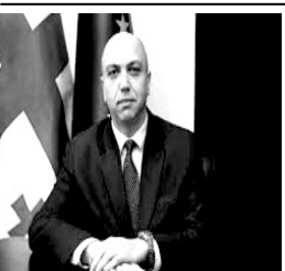
İrakli Karseladze Gürcüstanın regional inkışaf və infrastruktur naziri